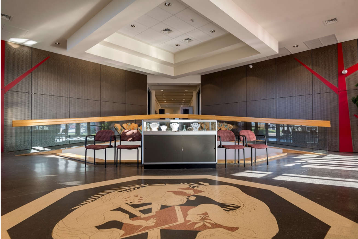
Vue sur l'agora rénovée en 2018-2019.